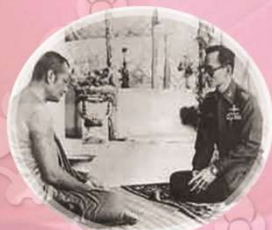
พระอาจารย์วัน อุตตโม