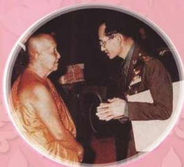
หลวงปู่สิม พุทธาจาโร