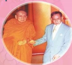
สมเด็จพระสังฆราช เจริญ สวทุฒโน