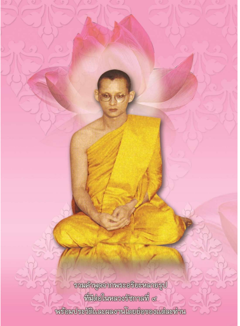
รวมคำพูดจากพระอริยะหลายรูป ที่มีต่อในหลวงรัชกาลที่ ๙ พร้อมประวัติและผลงานโดยย่อของแต่ละท่าน