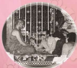
หลวงพ่อหุส ฐาภิโย