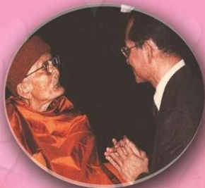
หลวงปู่แหวน สุจิณฺโณ